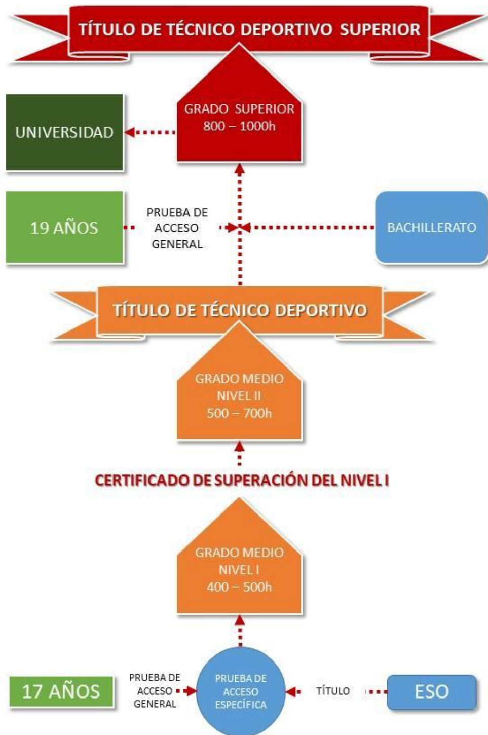
Ilustración 3 EDRE